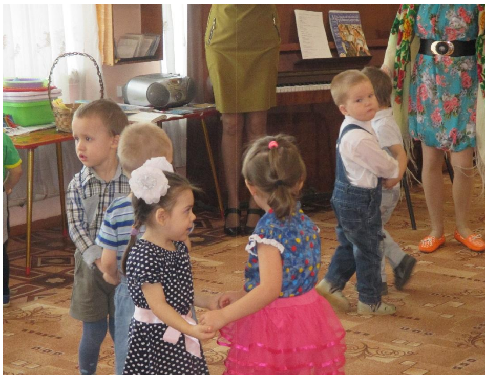
Праздник «Мамочка моя»