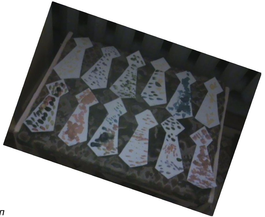
Подарки для пап